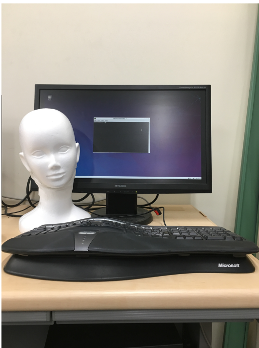
図 1 提案システム