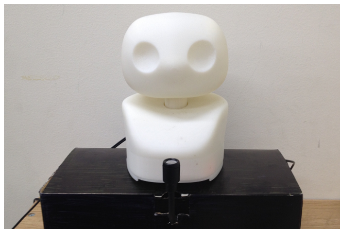
図2 実験で使したロボット