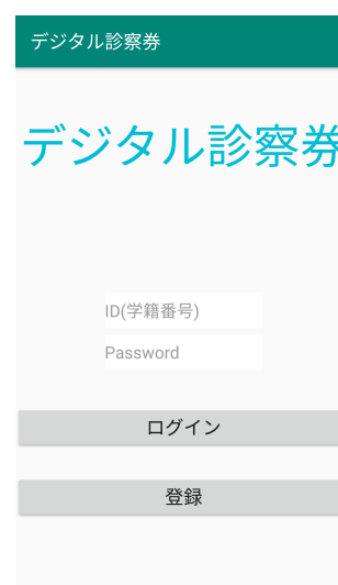
図 2 アプリ起動画面