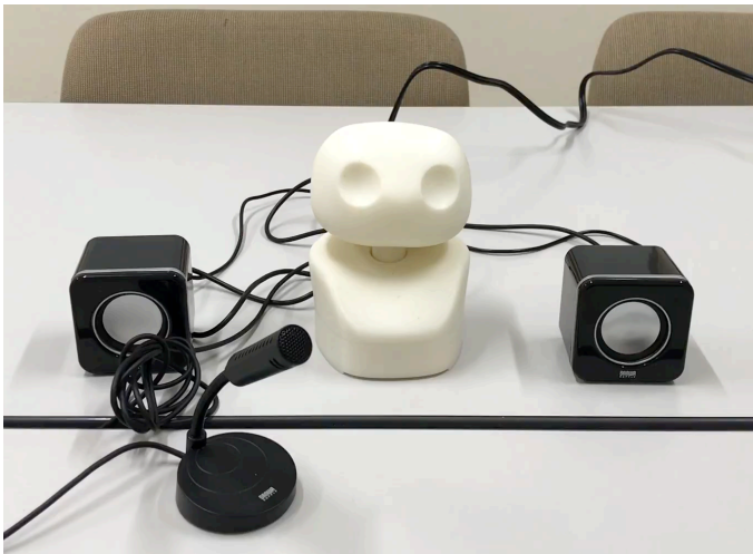
図1 開発したロボット